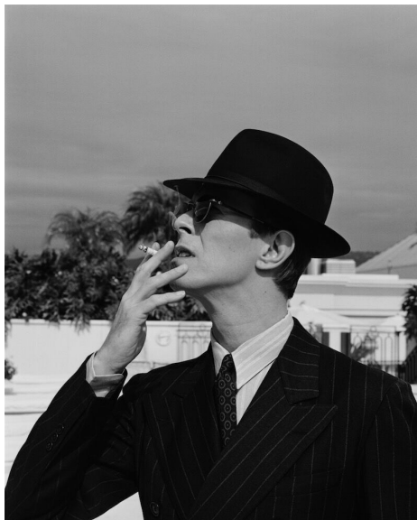
David Bowie

Tra i protagonisti dei suoi ritratti anche gente comune, e poi icone: Uma Thurman, Jennifer Lopez, Denzel Washington, Clint Eastwood, Martin Scorsese, Francis Ford Coppola, Faye Dunaway, Kylie Minogue, Debbie Harry, Nicholas Cage, Tupac Shakur, Sean Connery, Tim Burton... .