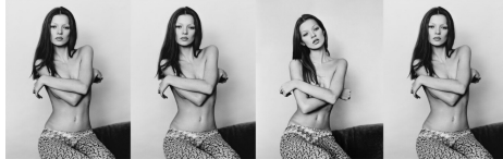
Kate Moss

grandi artisti, stelle del rock, top model, popstar, attori: con la sua macchina fotografica Michel Haddi ha immortalato vip e celebrità da tutto il mondo e di ogni genere. Difficile immaginare quanti scatti abbia realizzato, nel corso della sua carriera, il fotografo francese, protagonista di una mostra a ingresso libero, Pop Style Icons , che da oggi al 30 luglio, al Barberino Designer Outlet, riunirà più di quaranta immagini selezionate dallo stesso autore in collaborazione con la galleria Ono Arte Contemporanea di Bologna .